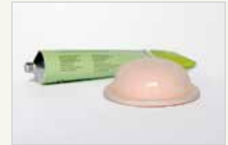
Diaphragma Le diaphragme