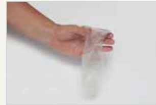
Frauenkondom Le préservatif féminin