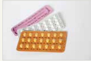
Die Pille – „kombinierte Pille“ La pilule