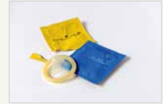
Kondom Le préservatif