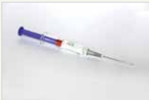
Dreimonatsspritze Le contraceptif injectable trimestriel