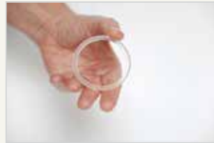
Verhütungsring L'anneau vaginal