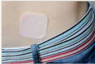
Verhütungspflaster Le patch contraceptif