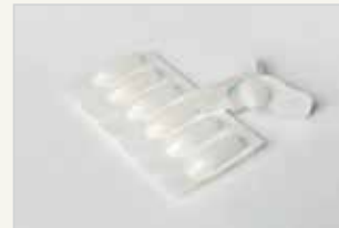
Chemische Verhütungsmittel – Zäpfchen Moyen de contraception chimique – le suppositoire