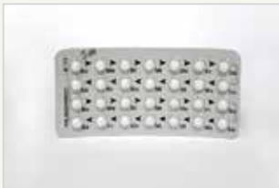
Minipille La minipilule