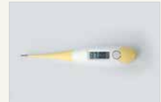
Temperaturmethode – ein Bestandteil der Methoden der Fruchtbarkeitswahrnehmung La méthode de la température – fait partie de la contraception naturelle