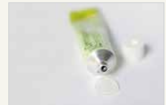
Chemische Verhütungsmittel – Gel Moyen de contraception chimique – gel