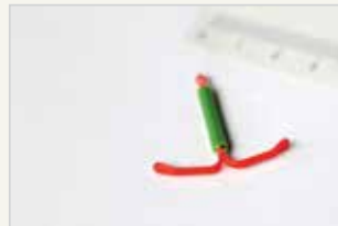
Hormonspirale Le stérilet