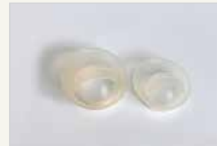
Verhütungskappe Le capuchon cervical