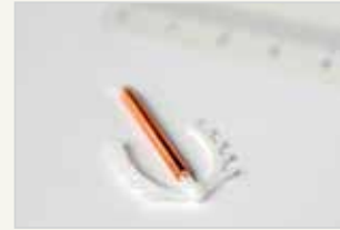
Kupferspirale Le stérilet en cuivre