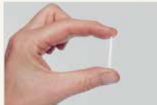
Hormonimplantat L'implant aux hormones