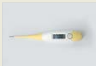
Temperaturmethode – ein Bestandteil der Methoden der Fruchtbarkeits- wahrnehmung Rêbaza germahiya leşî