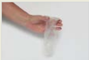
Frauenkondom Kandoma Jinan