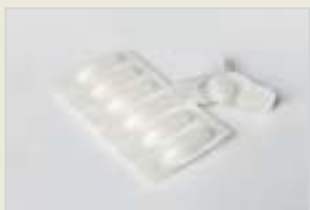
Chemische Verhütungsmittel – Zäpfchen Amora Kîmyayî ya Pêşîlêgirtina ji Ducanîbûnê – Şiyaf