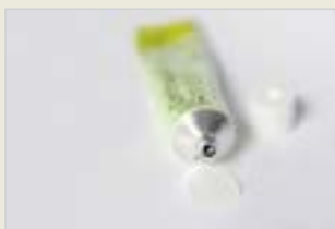
Chemische Verhütungsmittel – Gel Amora Kîmyayî ya Pêşîlêgirtina ji Ducanîbûnê – Jêle