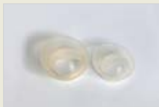
Verhütungskappe Kumika Malzarokê