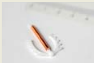
Kupferspirale Spîrala (IUD) Mîsî